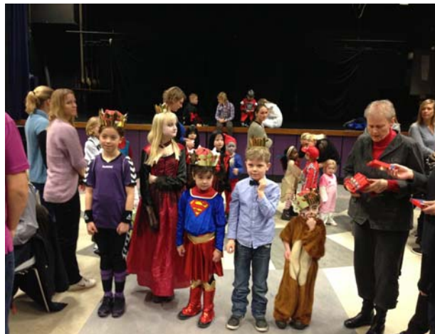
Præmier til kattedronninger og -konger