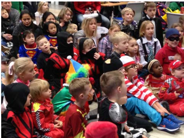
Børnene underholdes af en tryllekunstner

Den 9. februar afholdte grundejerforeningen fastelavnsfest for ca. 80 børn. Her er nogle billeder fra fastelavnsfesten: